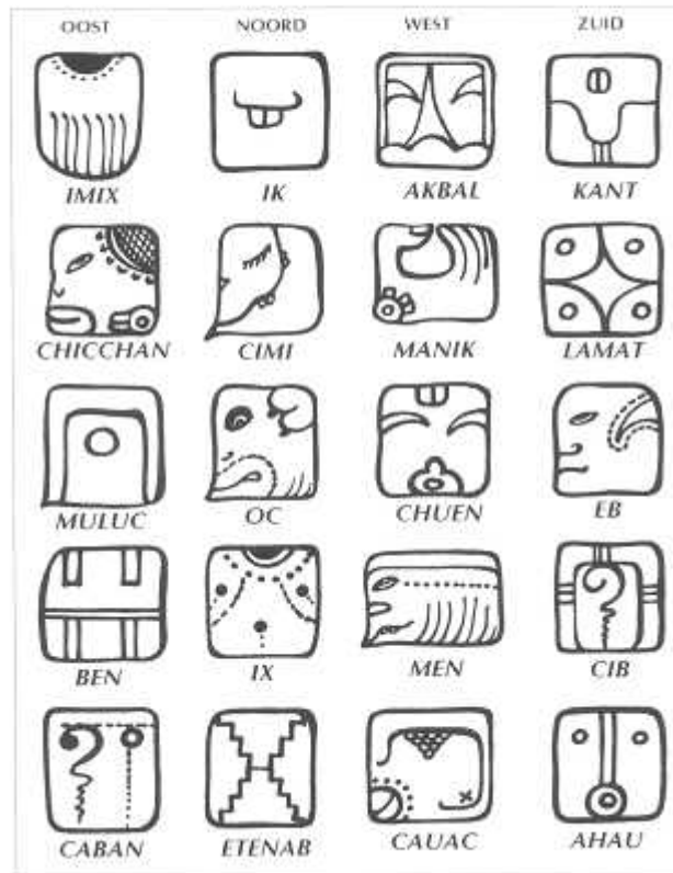
Abt. 14 Twintig Zonnezegels met hun Mayanamen.