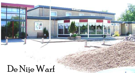
De Nije Warf

Je zicht zal pas scherp worden als je in je eigen hart kunt kijken.