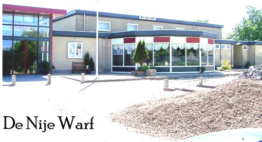
De Nije Warf

Als er rechtschapenheid is in je hart, zal er schoonheid zijn in je karakter.